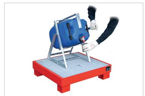
Kanister-Abfüllhilfe KAH-60 mit Auffangwanne AW 60-2/M