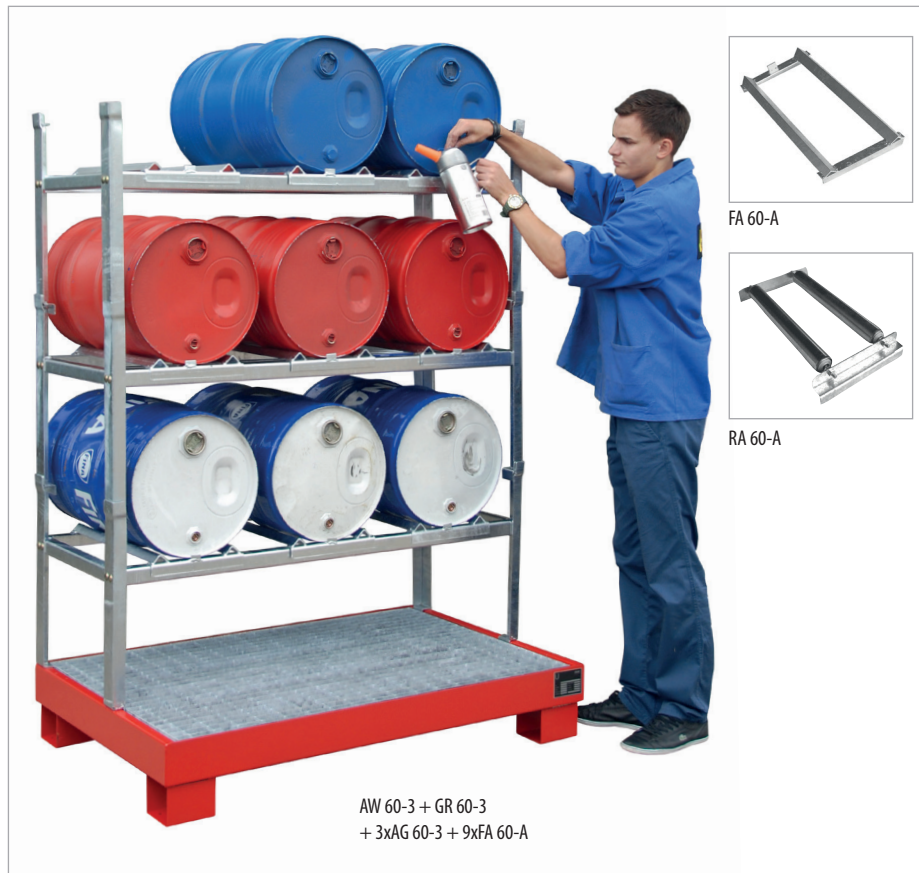
AW 60-3 + GR 60-3 + 3xAG 60-3 + 9xFA 60-A