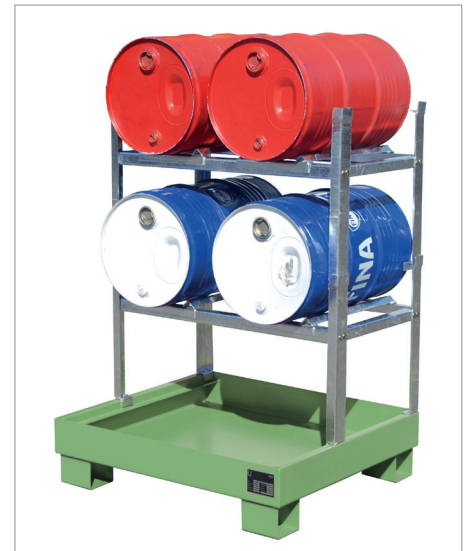
AW 60-2 + 2xAG 60-2 + 4xFA 60-A