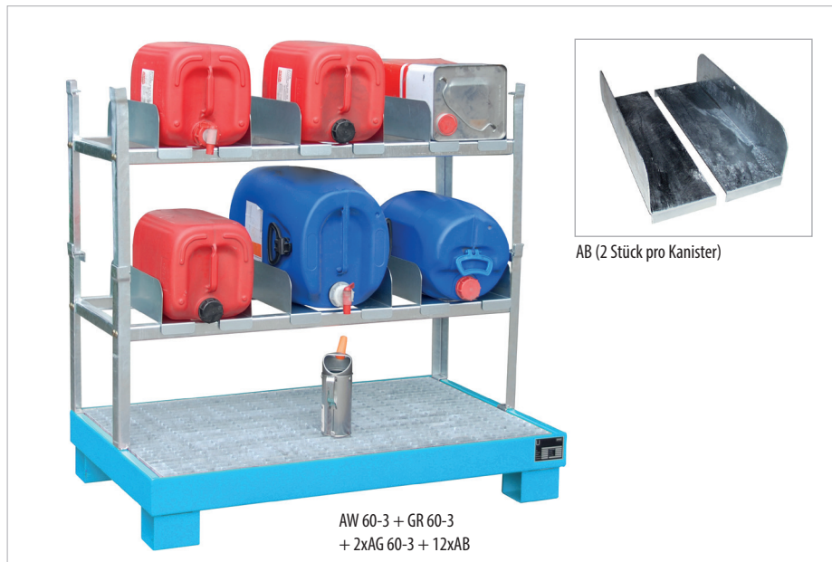
AW 60-3 + GR 60-3 + 2xAG 60-3 + 12xAB